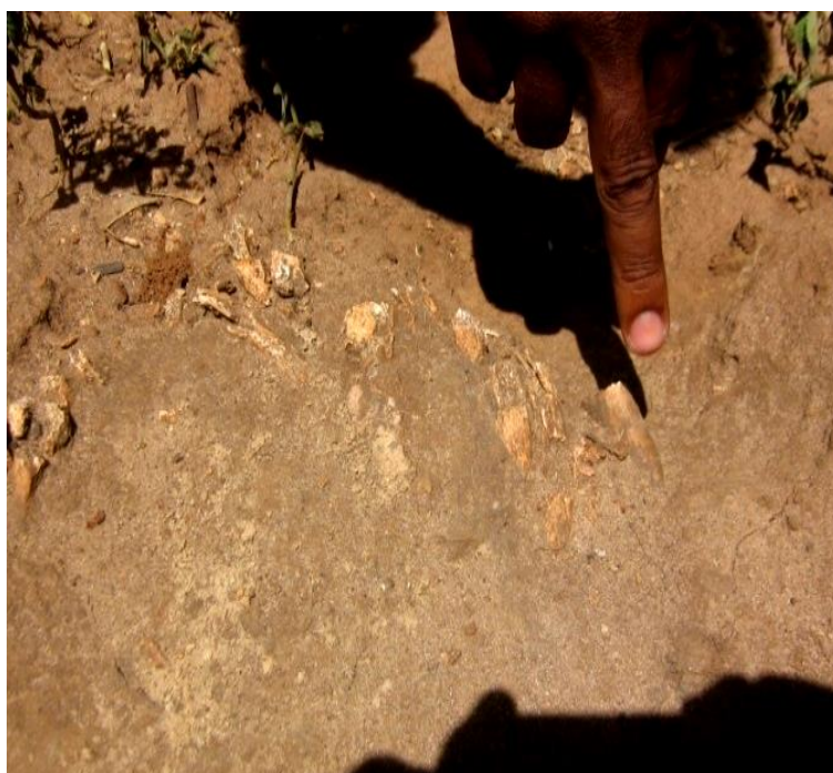
Figura 3 - Parte da coluna vertebral encontrada em de caminho de acesso à Lagoa das Piranhas

A imagem a seguir ilustra os resquícios desta ocupação conflituosa, no entanto, este não é o objetivo desta pesquisa e carece de mais estudos (VILAS BOAS e MATOS, 2009, P. 26).