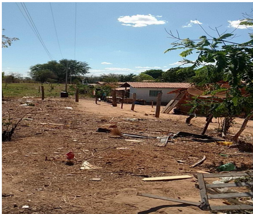
Figura 5- Cerca do fazendeiro ao fundo das residências (2017).

Não obstante, hoje se reconhecem enquanto comunidade negra descendente dos quilombos e, desde então, estão em processo contínuo de luta e exigem do Estado tal reconhecimento enquanto sujeito coletivo de direito; buscam políticas públicas que melhorem a qualidade de vida das famílias, a exemplo de escola, habitação, estrada e, acima de tudo, desejam a regularização de seu território.