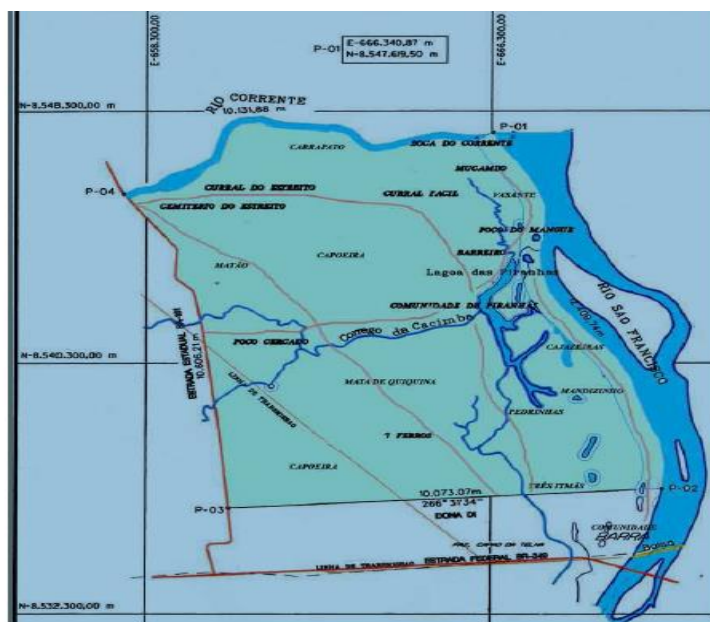
Mapa do território de Lagoa das Piranhas, com os nomes tradicionais das localidades e as estradas (linhas vermelhas) do Estreito, do Poço Cercado, das Cajazeiras, dos Romeiros (que ligava o Estreito ao 7 Ferros) e a das Três Irmãs.