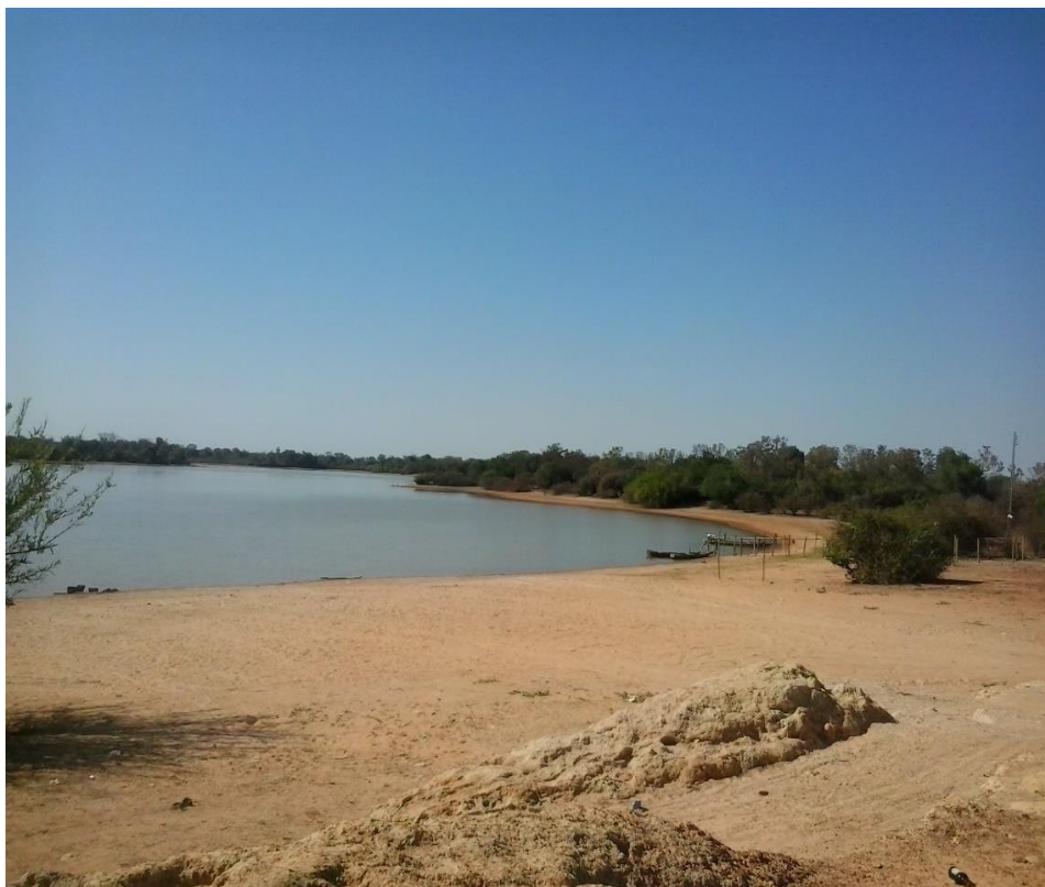
Figura 4 – A Lagoa das Piranhas (2014).

O quilombo de Lagoa das Piranhas está contido nesse processo mais amplo de organização e que se articula com as demais comunidades negras desta região. O debate acerca de sua realidade conflituosa, sua luta por garantia de direitos é uma delas. Um exemplo de luta diz respeito à Lagoa das Piranhas, além das origens da comunidade é a principal fonte de economia e vida do quilombo. No entanto, a mesma acaba sendo, também, uma das demandas da comunidade, por conta do alto grau de degradação em que a mesma se encontra.